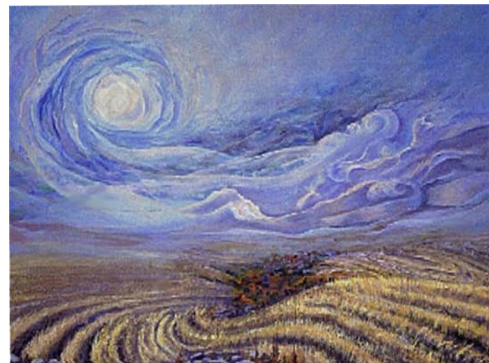
"Il Vento" di Vincent Van Gogh